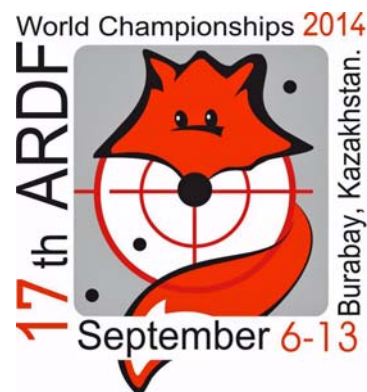
1412. Logo: 17e ARDF IARU Wereldkampioenschappen

Het is ook nu mogelijk om aan het complete programma of aan een deel van het programma mee te doen. De volgende pakketten worden aangeboden [1415].