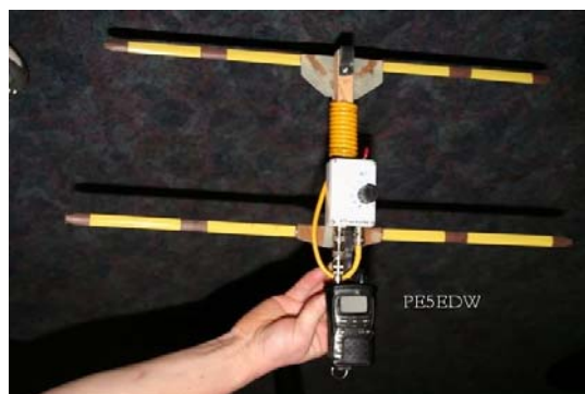
De “Shorty” met VX-2E en Offset-verzwakker