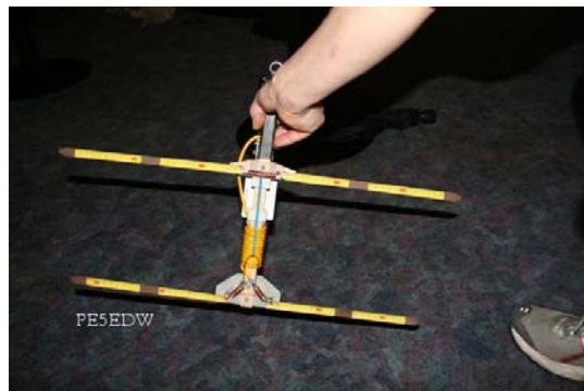
De “Shorty” met galvanische nul (blauw)